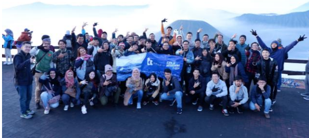
*Grup Kata AI Jakarta