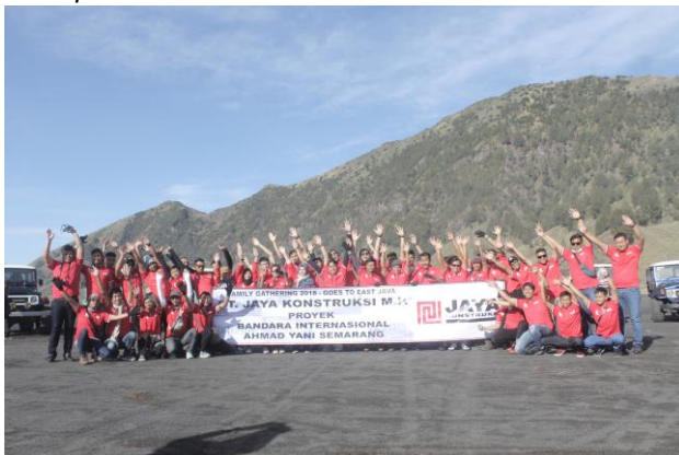
*Grup PT Jaya Konstruksi