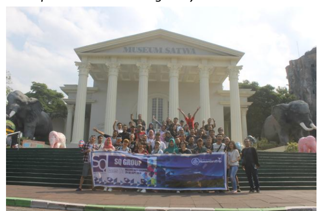
*Grup Sertco Quality