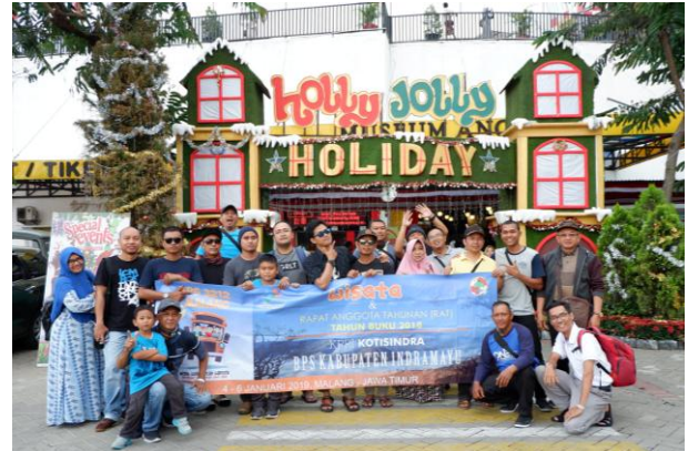
* Grup BPS Indramayu