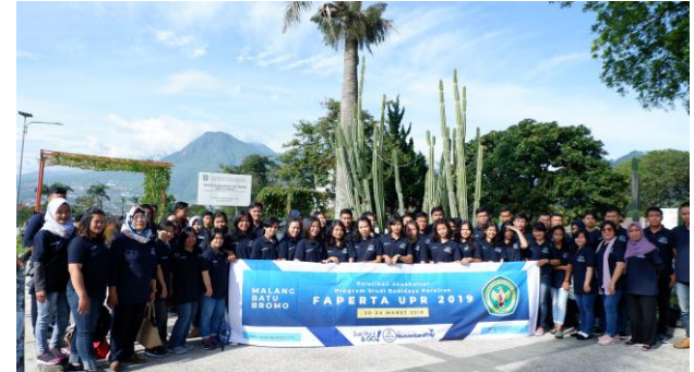
*Grup Universitas Palangkaraya