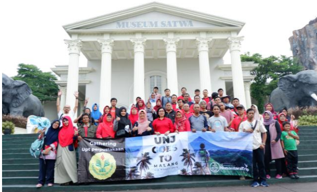
*Grup Universitas Negeri Jakarta