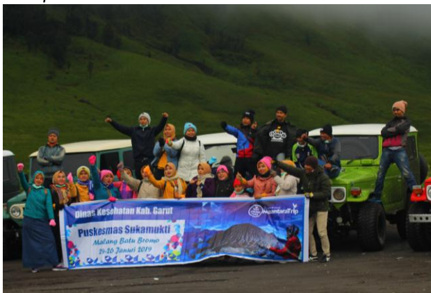
* Grup Dinkes Kab Garut