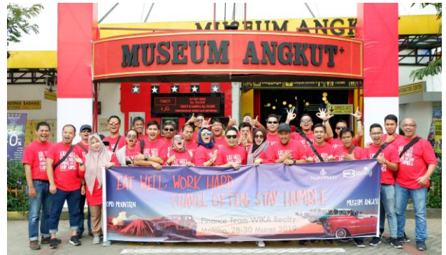
*Grup Wika Realty